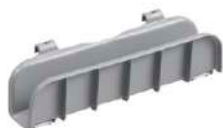
Soporte para bastidores